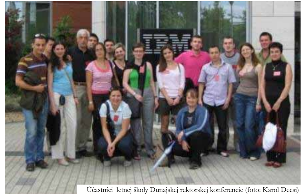
Účastníci letnej školy Dunajskej rektorskej konferencie