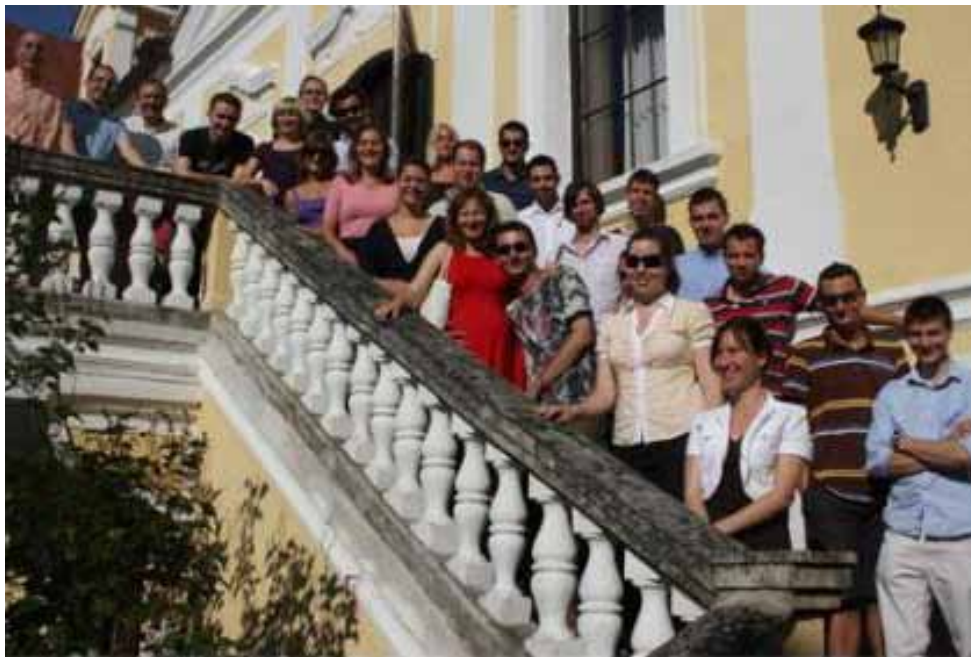
Účastníci Európskej akadémie

V dňoch 13. – 17. júla 2009 sa Karol Decsi zúčastnil Európskej akadémie organizovanej