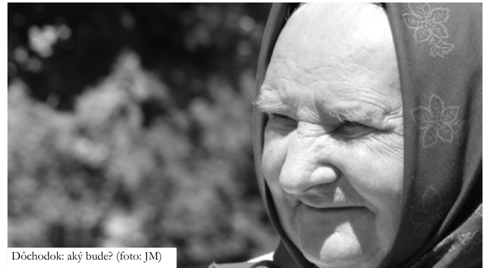
Dôchodok: aký bude?

Zavedenie 2. kapitalizačného piliera je do istej miery východiskom pri snahe o elimináciu politických nákladov reformy. Okamžité finančné náklady zavedenia 2. piliera (spojené s nutnosťou zabezpečiť už vzniknuté nároky voči priebežnému systému) nebývajú sprevádzané